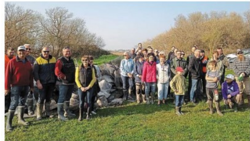
Le chantier de nettoyage du havre de Geffosses a réuni une soixantaine de bénévoles.