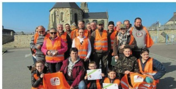
Après la collecte des déchets, le groupe a posé avec fierté et bonne humeur pour la photo souvenir « J'aime la nature propre »

Une chasse aux déchets dans la bonne humeur