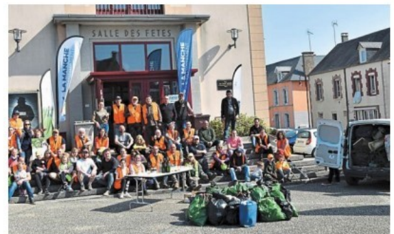
Dimanche, ils sont une centaine à avoir participé à l'opération de ramassage des déchets.