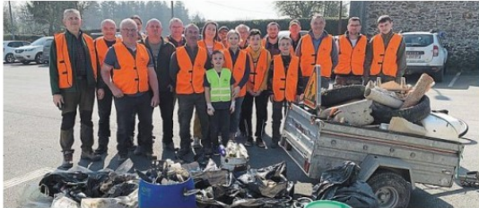
Samedi, une collecte de déchets sauvages a été organisée dans la commune.

Beaucoup de déchets ramassés dans la commune