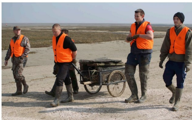
→ À la pointe de Brévands hier matin, et chapeauté par l'association de chasse maritime de la côte Est et Nord Cotentin baie des Veys, l'opération environnementale de nettoyage du site naturel a mobilisé sur place toutes les bonnes volontés.

Tout ce week-end et se déroulant en demi-journées, les ramassages de déchets font