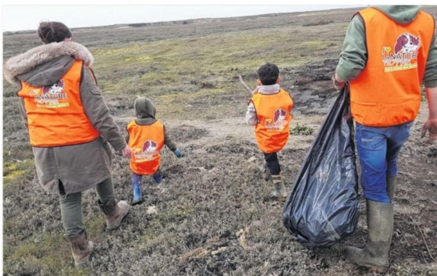
Une opération de ramassage de déchets est prévue sur la commune des Biards.

La fédération de chasse de la Manche organise une opération de déchets aux Biards le dimanche 27 mars.