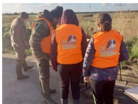
► L'opération avait mobilisé 150 bénévoles l'an dernier.

G. P. ► Plus d'infos sur fd50.com / j'aime-la-nature-propre-manche .