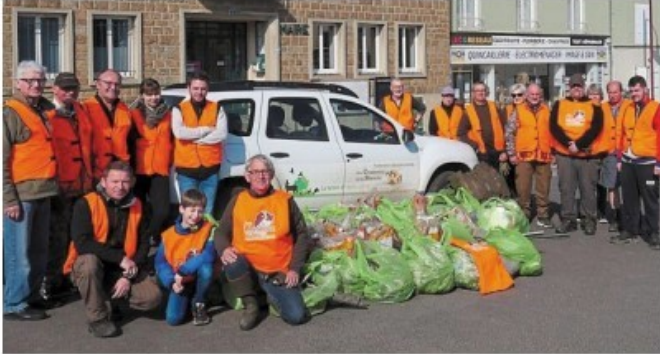
La vingtaine de bénévoles s'est réunie devant la mairie avec leur « récolte ».